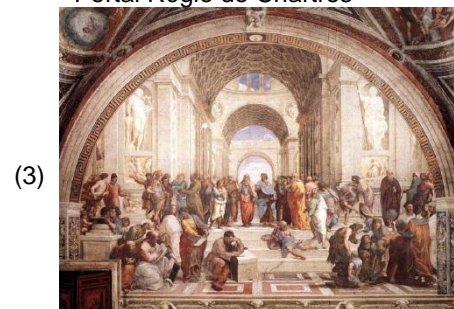
A Escola de Atenas