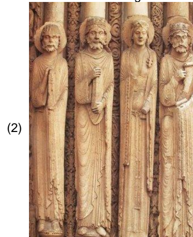
Portal Régio de Chartres