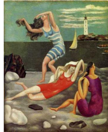
Picasso. As banhistas, 1918.

Um professor apresenta a obra “As banhistas” de Picasso a um grupo de alunos, pois pretende investigar o nível de compreensão estética das crianças. Abigail Housen (1983) classifica em cinco estágios o desenvolvimento estético: primeiro estágio: descritivo ou narrativo; segundo estágio: construtivo; terceiro estágio: classificativo; quarto estágio: interpretativo; quinto estágio: recreativo. Uma aluna faz os seguintes comentários sobre a imagem: